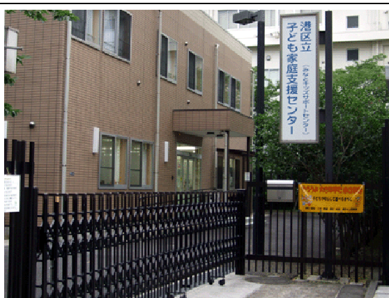
港区立子ども家庭支援センター入口 (伸縮門扉引戸)